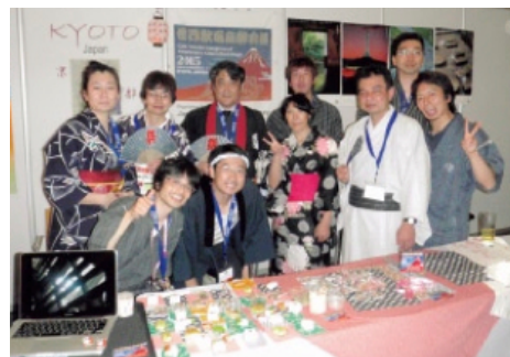
写真2: JAPAN Nightを終えて